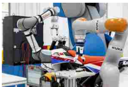
Esempio di robot collaborativo a disposizione del Made per la realizzazione di parti automotive

«I competence center sono una voce predominante che piano piano sta prendendo sempre più consistenza all'interno del mercato italiano – sottolinea lo show director di Sps Italia – Per noi è necessario continuare il dialogo con i centri di competenza e proseguire con questo atteggiamento di collaborazione e di apertura tra mondo accademico e industriale ». Quindi mettere a fattor comune la ricerca e le conoscenze per trovare nuove soluzioni che non migliorino la singola azienda ma tutto il mercato italiano, e permettano lo sviluppo dell'industria in ottica digitale e 4.0 è alla base dell'ecosistema virtuoso che lega i Digital Days al mondo universitario e dei competence center. E che consente a Sps di allargare il network e far parlare la community al proprio interno.