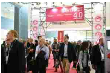
Il district 4.0 di Sps. In un'ottica futura la combinazione del mondo fisico con quello digitale è plausibile e auspicabile, sicuramente convergeranno e si alimenteranno a vicenda

Una stretta di mano, un caffè bevuto insieme al vendor allo stand mentre racconta le peculiarità della soluzione che stiamo visionando: siamo tutti d'accordo nel dire che la potenza di una manifestazione fisica è diversa rispetto a quella che si può sprigionare con il digitale . Ma siamo sicuri che, una volta riconquistata la libertà, abbandoneremo del tutto gli eventi virtuali? «In un'ottica futura la combinazione dei due mondi è plausibile e auspicabile, sicuramente convergeranno e si alimenteranno a vicenda – commenta Lopizzo – si tratta di canali di comunicazione diversi, così come sono differenti i profili che interagiscono principalmente sui contenuti online. Alcuni di essi non li avevamo nei nostri database: per noi sono tutti utenti altamente profilati ma che non avevamo ancora incontrato in una manifestazione fisica». L'idea in SPS Italia è quella di trovare una strada comune che porti a potenziare l'evento fisico con tutti gli strumenti virtuali che hanno costruito in quest'ultimo anno, anche perché è stato notato come una sezione di utenti abbia più confidenza con questo tipo di offerta e di contenuti. L'obiettivo è quello di trovare un modo per aumentare la fiera fisica, offrendo dei servizi in più e rendendoli disponibili anche in modo