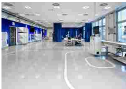
La Linea Pilota Digital Factory di CIM4.0

E proprio la possibilità di fare networking in modo mirato, entrando in contatto con una selezione di aziende – circa 90 – che rappresentano l'offerta più innovativa e completa in termini di tecnologie abilitanti è alla base di SPS Italia Digital Days 2021 . Che per facilitare gli incontri virtuali ha istituito la nuova funzione di matchmaking , un modo in più per le imprese espositrici e i visitatori di entrare in contatto come in fiera. «Una delle novità di quest'anno è il lancio del matchmaking , che permetterà agli espositori di entrare in contatto con il database utenti di Contact Place – ci racconta Lopizzo – Ci saranno delle segnalazioni in base ai prodotti che sono risultati più interessanti, e anche in relazione all'attività che lo user ha effettuato sulla piattaforma. Il nostro obiettivo, che è stimolare il dialogo nella community , si muove su un doppio binario: non solo aiutiamo i nostri visitatori a trovare le soluzioni che stanno cercando all'interno di SPS, ma agevoliamo chi fornisce le soluzioni nella ricerca di nuovi clienti».