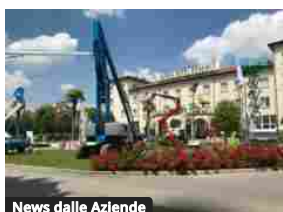
News dalle Aziende

IPAF ANCH'IO 2022, l'impegno di tutti per la sicurezza