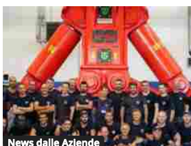
News dalle Aziende

CASE lancia la nuova gamma di miniescavatori Serie D in 20 modelli