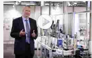
Visita virtuale all'innovazione digitale nel motion Festo