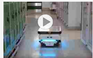
Robot mobili autonomi MiR, automazione sicura negli ospedali