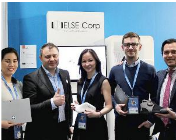
IN CORSA La squadra dell'Else Corp Team