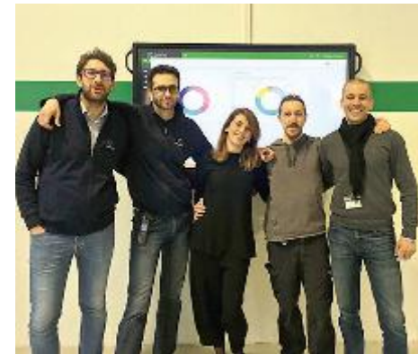
IMPEGNO Il team Fluid o-tech al gran completo

SE CORP , Fluid-o-Tech, Glass to Power, Sfera Labs e ZetaPunto sono i finalisti del primo Innovation Dream Engineering Award (Idea), il concorso dell'Ordine degli Ingegneri di Milano, InnoVits, SPS IPC Drives Italia , Bureau Veritas Italia, Innovation Post, Azimut e Fondazione Italiana Accenture, col patrocinio di Assolombarda. L'obiettivo è valorizzare 5 progetti imprenditoriali nel segno dell'industria 4.0. La challenge si concluderà il 20 febbraio al Politecnico dove i 5 migliori progetti innovativi si presenteranno davanti a una platea di stakeholders, imprenditori e operatori del settore per tentare di aggiudicarsi il primo premio: 50 ore di formazione offerte dalla Fondazione dell'Ordine degli Ingegneri e un canale aperto con la Commissione Startup e Settori Innovativi, Informatica e InnoVits per lo sviluppo del progetto.