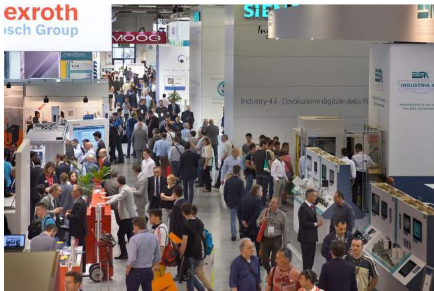
SPS IPC DRIVES ITALIA, UN MOMENTO DELL' EDIZIONE DELLO SCORSO ANNO

Le aziende presenti in quest'area saranno: Microsoft, Oracle, SAP, Sygest, Techsol, Alascom Services, Altair Engineering, Altea UP, app2b, C.si.co, Efa automazione, Endian, Eplan, EsiSoftware, Gruppo Infor, IBM, Pentaconsulting, Reweb, STMicroelectronics, Tenenga, Var Group, Vision, Anie – gruppo software, Microsoft / Kuka, Oracle / Bosch, SAP / Camozzi, Ibm / Hilscher / Mitsubishi, Var Group / Esa, Wago, Rockwell Automation, Abb / Rold / Samsung, Bonfiglioli, Lenze, Siemens, Porche consulting.