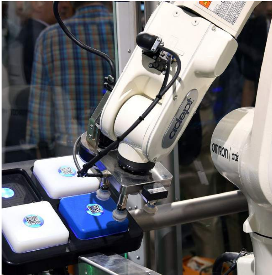
SPS IPC DRIVES ITALIA, DALL' EDIZIONE DELLO SCORSO ANNO