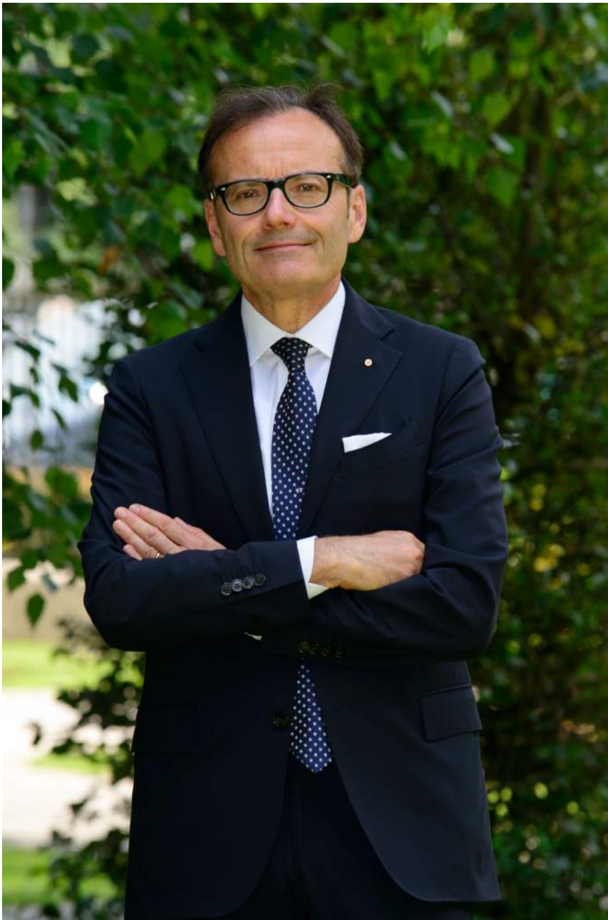
MASSIMO CARBONIERO, PRESIDENTE UCIMU

È tenendo presente gli elementi che hanno portato a questa valutazione che bisognerà guardare con particolare interesse all' appuntamento, giusto tra poco meno di un mese, con la più importante manifestazione fieristica italiana dedicata all'automazione e al digitale per l'industria, SPS IPC Drives , che si aprirà il 22 maggio a Parma. Sarà un test importante per capire se, sull'abbrivio dei risultati positivi del 2017, le imprese proseguiranno nell'opera di rinnovamento dei loro impianti, nel segno della digital transformation e di Industry 4.0.