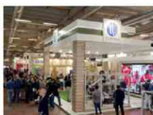
MECSPE 2017, anticipatrice dei trend tecnologici