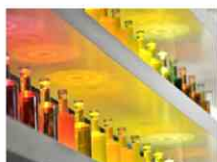
drinktec 2017 ai blocchi di partenza